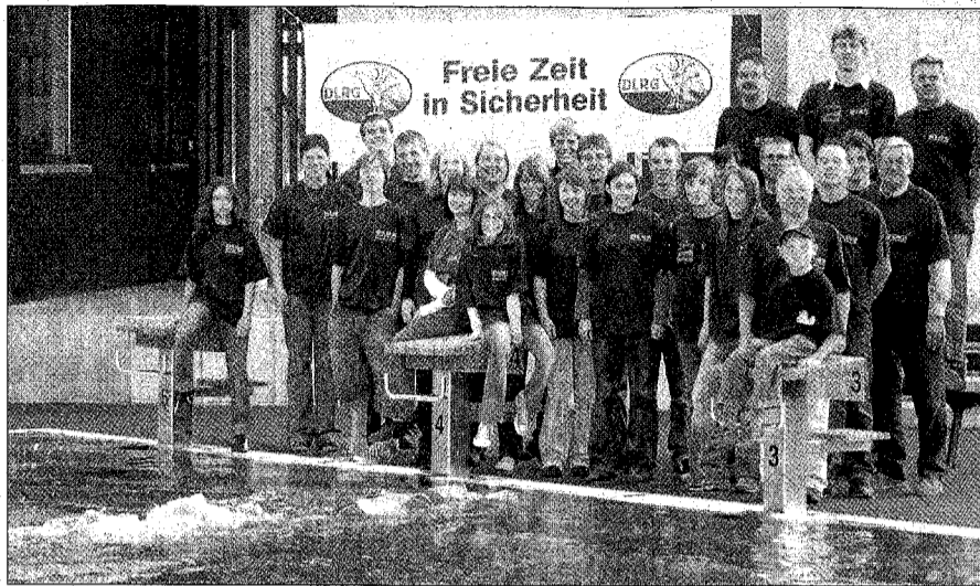
Die DLRG-Wachmannschaft im Waiblinger Freibad.